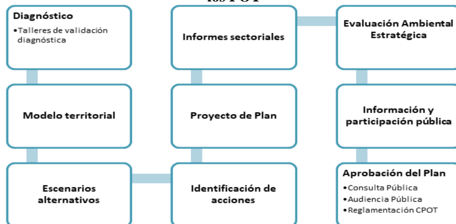
Gráfico 1: Secuencia del proceso de planificación del desarrollo para la elaboración de los POT

de la autoridad de aplicación” (art. 44. Ley No 8051/09), mientras que las audiencias públicas se convocan posterior a la consulta pública para resolver temas trascendentales para la población de la provincia (art. 48. Ley N.º 8051/09). Además, la norma contempla la existencia de un Consejo Provincial de Ordenamiento Territorial (CPOT). Se trata de un organismo consultor y asesor, creado por el artículo 40 de la Ley N.º 8051 y conformado por representantes de organismos provinciales, municipios y organizaciones de la sociedad civil vinculadas a las temáticas territoriales.